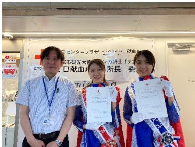
宝塚市観光大使「サファイア」による 1 日献血ルーム所長 委嘱