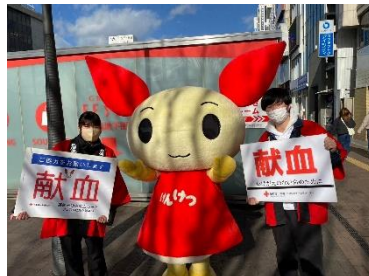
全国学生クリスマス献血キャンペーン (兵庫県学生献血推進協議会)