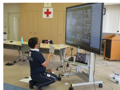
オンライン講習(幼児安全法)

また、住み慣れた地域で自分らしい暮らしを続けることができるよう、自助・互助・共助・公助を踏まえて健康の維持・増進と高齢期の自立を促す方法を普及する。