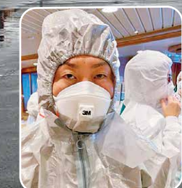
活動する赤十字職員