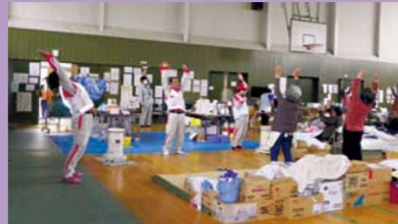
被災者の皆さんと体操の時間