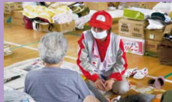
避難所ではこころのケアも大切

の状況は、車の通る道はあるものの、山積みされた瓦礫、陸地に打ち上げられた船、なぎ倒された家屋など、地震、火災、津波被害の爪痕やには生々しく広がったままです。一日も早い、復旧、復興に向け、日本赤十字社は今後も支援活動を続けてまいります。