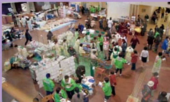
多くの患者を受入れた石巻赤十字病院

津波により浸水、建物の損壊等で診療不能となっていることから、市内で唯一医療機能が維持されている石巻赤十字病院(病床数402床)に被災者が集中。病棟にマットレスを敷き入院増に対応するなど、いのちを支える拠点として活動を続けています。