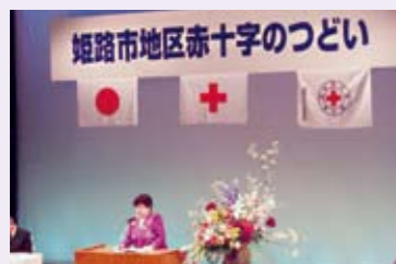
有馬姫路市赤十字奉仕団委員長の挨拶

5月10日、イーグレひめじ あいめっせホールにおいて奉仕団員約200人が参加して「平成23年度姫路市地区赤十字のつどい」が開催されました。