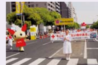
けんけつちゃんも参加して 東日本にエール