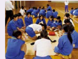
一次救命に取り組む生徒たち

2年生140人が参加。万一、毎日の生活の中で、友達や家族が目の前で倒れたら・・・生徒たちは練習用人形に戸惑いながらも、勇気を出して手当が行えるように、胸骨圧迫やAEDの使い方を学びました。