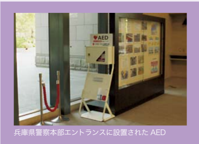
兵庫県警察本部エントランスに設置されたAED

また、今年からは心肺停止例の救命率向上のため、兵庫県警察のご協力により、7ヵ年計画で合計140台のAEDを、県内の警察施設に設置することになり、今年度は、兵庫県警察本部、運転免許試験場や更新センター、西播磨管内の警察署などに16台を設置しました。これからも、県民の皆さまのさらなる安心・安全を