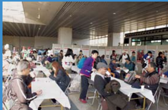
庁舎1階には大勢のウォーク参加者が