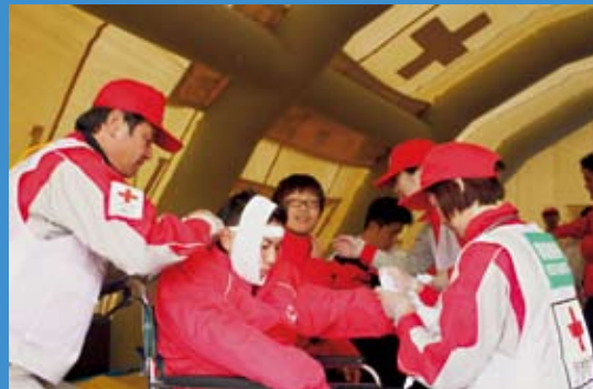
dERUを展開しての防災訓練

※dERUとは、国内型仮設診療所ユニットのこと。大型テント、医療資機材、通信機器等で構成されている。