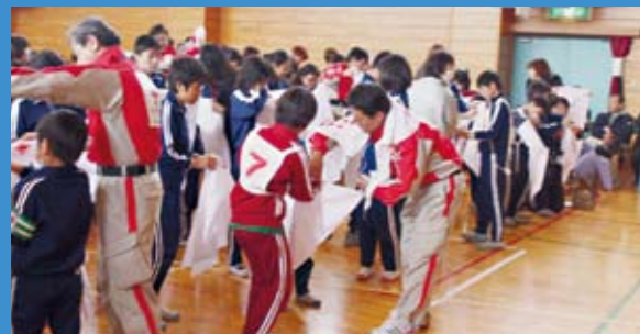
一生懸命に三角巾での手当てを習う児童たち

たたみ方を覚えた高学年の児童は、1年生や2年生に三角巾を巻き、傷の手当てをします。三角巾を巻いてもらった腕を見て、「わあ、これすごーい」と声をあげ、応急救護訓練終了後も包帯