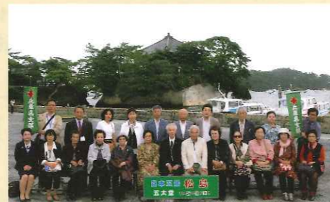
松島にて集合写真

最終日は日赤岩手県支部を訪問し、東日本大震災における被災地の状況や赤十字の活動について説明を受け、参加された方からは「さらに認識を深めることができた」との感想もいただきました。また、兵庫県支部が医療救護活動を展開した沿岸部の各所を巡りました。未だ震災の爪痕が残る情景を目の当たりにして、自然の猛威をあらためて考えさせられましたが、同時に、観光産業が地域を支える大きな柱であり、震災前と同様にもっと多くの方々が各地を訪れることも大きな復興支援になるとの思いを募らせながら、無事に3日間の行程を終えました。