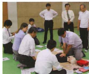
武庫川女子大学附属中学校・高等学校