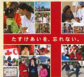
たすけあいを、忘れない。