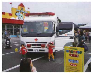
救急車の前ではちびっこが記念撮影。はい、ポーズ!

「子どもが大好きな乗り物なんです」「さっきも乗らせてもらって、もう一回乗りにきました」などの声も多く聞かれました。2日目には雨が降ることもありましたが、たくさん子どもたちとその保護者の方々に赤十字活動を紹介することができ、有意義なイベント参加となりました。