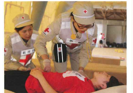
エアートント内で傷病者を診る学生

今回のトレーニングセンターを通して、学生たちは被災者への理解と災害現場における救護活動への意識を高め、メンバー間の絆を深める機会となったようです。