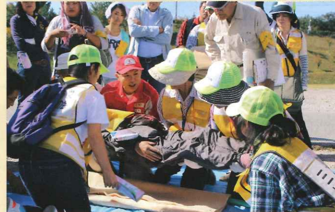
毛布を使って担架搬送

9月29日(日)三木山総合公園で三木市総合防災訓練が実施されました。兵庫県支部では、応急手当の訓練に参加するとともに展示ブースで災害救護活動のPRを行いました。市民参加型の応急手当実施訓練は初めての試みということもあり、三角巾を使っての災害時に役立つ傷への包帯の方法、毛布を使っての担架搬送などを、一般住民やボランティアの方々に体験していただきました。また、展示ブースでは、災害時に被災者に配られる救援物資を見て質問される方もおられ、普段見ることが少ない展示物を興味深く見物されていました。