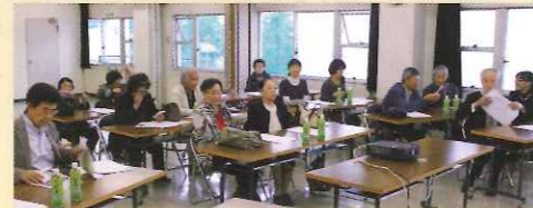
岩手県支部にて説明を受けられる参加者の皆さん

兵庫県日赤有功会は、日本赤十字社に対し多大の尽力をされたことにより、有功章を受章された方々によって組織され、赤十字事業を側面から支えていただいています。 日本赤十字社兵庫県支部ではご支援いただける新規会員を募集しています。 詳しくは振興課(078-241-8921)まで。