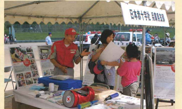
展示ブースで活動PR