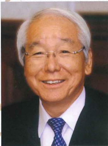
日本赤十字社兵庫県支部 支部長(兵庫県知事)