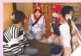
避難所の被災者に声をかける看護師