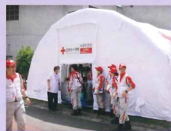
熊本地震での避難所に仮設診療所を設置 (神戸新聞掲載記事転載)

平成28年4月16日(土)午前9時、神戸赤十字病院からはdERUチーム(国内型緊急対応ユニット)11人が、姫路赤十字病院からは兵庫DMAT(災害医療チーム)として5人が熊本県の被災地に向け出動しました。被災地では医療機関や避難所へのアセスメントなどの活動を実施。さらに、避難所においては仮設診療所を展開し、被災者の診療や健康管理を行っています。引き続き日本赤十字社兵庫県支部では被災地支援に取り組んでまいります。