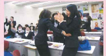
全員合格の知らせに大喜びする学生たち

いのちと尊厳を守る赤十字の看護を継承した学生たち。ますますの活躍を期待しています。