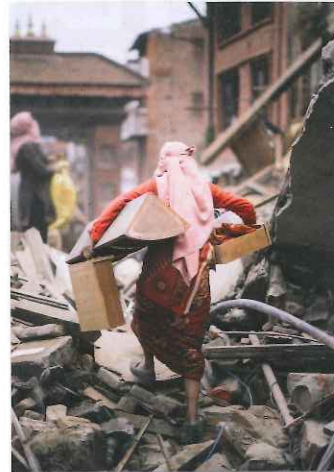
人がいま、試されている。

運動月間中は、皆さまの地域の赤十字奉仕団や自治会、婦人会などを通じて、活動資金へのご協力をお願いしています。