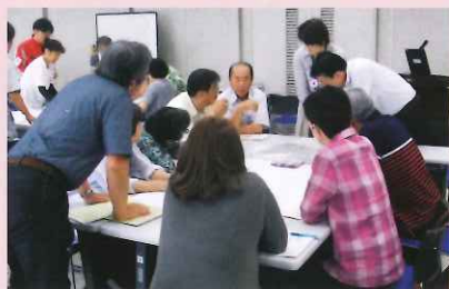
広げた地図を囲み、議論しながら安全なルートを確認する奉仕団員の皆さん

6月26日、福崎町文化センターにて「中播磨地区赤十字奉仕団員研修会」が開催され、福崎町、市川町、神河町から約40人が参加されました。