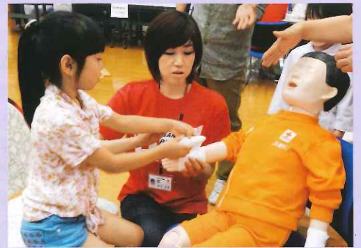
傷の手当てを体験中。上手く巻けるかな？

地域の人々に赤十字の活動を知ってもらい、赤十字をより身近に感じていただくこと、6月25日、ポップアップホール(丹波市)にて、柏原赤十字病院が「第5回赤十字ふれあい広場in丹(まごころ)の里」を開催しました。 丹波沼貫(ぬめぎ)よさこいチーム「一心貫(いっしんかん)」による元気いっぱいの演奏で始まったこのイベントには、300人を超える方々が来場。赤十字活動紹介パネルや防災グッズなどの展示、病院お仕事体験や救急法等ミニ講習会、認知症や乳がん自己触診チェック、救護服やナース服を着てのちびっこ記念撮影などの参加・体験型ブースを設置し、見て、知って、楽しんでいただきました。 また、平成30年度に県立柏原病院と統合し開院予定の新病院の紹介や丹波市赤十字奉仕団による炊き出し試食なども行いました。