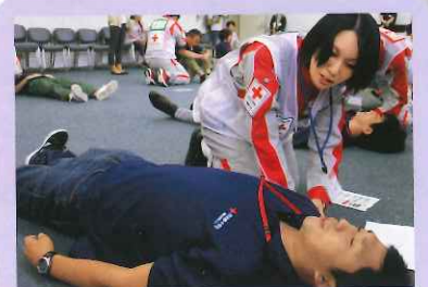
治療の優先を判断するトリアージ実習に取り組む当支部の救護要員

日本赤十字社では一人でも多くのいのちを救うために、いつ起こるか分からない災害に迅速に対応できるよう、今後も研修や訓練を通じてさらなるスキルアップを図ってまいります。