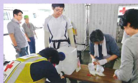
食品保存袋に米を入れ、湯せんによる炊飯の準備をする参加者

参加者からは、「ペットボトルや食品保存袋を湯せんした炊飯は、初めての体験だった。こんな方法があったことに驚いた」「研修や訓練を積み重ねていくことが大切と感じた」などの感想が聞かれました。