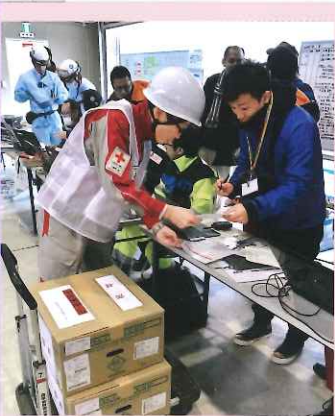
広域搬送医療施設(SCU)に 血液製剤を届ける血液センターの職員

いのちと健康を守る赤十字活動は、 皆さまからお寄せいただく活動資金で成り立っています