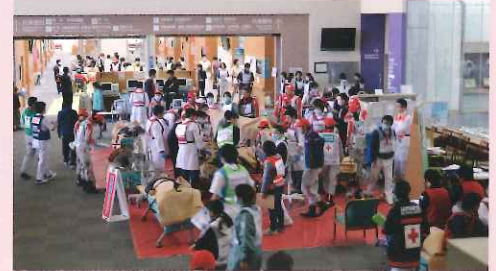
災害拠点病院研修で、 負傷者が次々と運び込まれる病院ロビー

運ばれてくる負傷者数や負傷の程度も知らされない実践型研修のため、人手不足となる部署や通信機器トラブルなどで混乱する場面もありましたが、課題を発見することもできました。実際の災害現場にはシナリオはありません。災害拠点病院として臨機応変に対応できるよう、今後も訓練・研修を重ねてまいります。