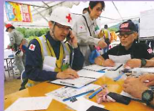
行政などの関係団体とニーズの調整をする防災ボランティア