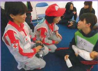
避難所でニーズの聞き取りや健康管理をする看護師

訓練に参加した職員は「赤十字職員として、災害救護への意識が明確となった。これからも研修や訓練を積み重ねて有事の際は迅速に動けるようにしたい。」と語っていました。