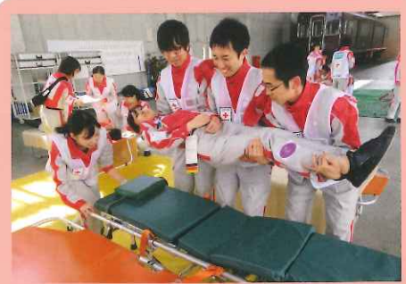
5/27 ストレッチャーでの搬送の様子

日本赤十字社の災害時の救護班の役割や災害医療、無線の使い方等の基礎を学んだ後、仮設診療所となるエアテント(dERU)を展開したり、担架やストレッチャーでの搬送、医師・看護師は治療の優先度を決定するトリアージや応急処置を体験。さらに、実際に事故を想定とした医療救護のシミュレーションを行いました。また、5月31日には、救護班の中での主事の役割、災害現場での情報収集や記録の仕方、無線機や衛星電話を使った情報伝達、医療機関と行政や関係機関の情報共有ツールである広域災害救急医療情報システム(EMIS)の操作方法などを平成29年度救護班主事研修として行いました。