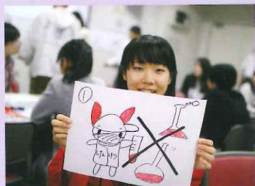
献血紙芝居の完成!

「こどもに献血の大切さを教える紙芝居を作ろう!」というグループワークでは、班ごとに与えられたテーマで紙芝居を製作。「輸血とは?」というテーマでは、参加者がけんけつちゃんのイラストを描き、「血液は造ることができないので、健康な人からの献血が必要なんだ!」と、献血の重要性を呼びかけました。