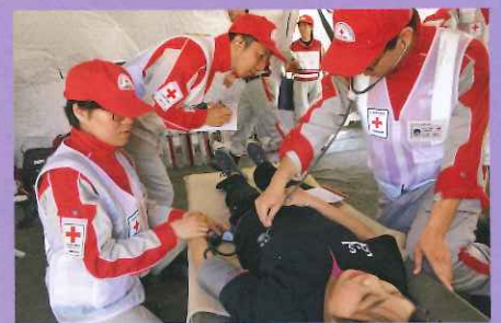
救護所で傷病者の医療救護を行う救護班員

三峠断層を震源とする震度6弱の直下型地震が発生したという想定で始まり、救護班が集結。災害対策本部参集訓練、救護所の開設・運営訓練、避難所の巡回診療訓練、ボランティアの受入訓練など、昨年の熊本地震での救護活動の教訓を生かした訓練を実施。避難所の巡回診療訓練では避難所責任者が様々な想定の子供に声をかけ避難所アセスメントを行いました。また、今回初の試みとなる災害対策本部参集訓練では、本部到着時の報告事項、情報収集、帰還時の本部報告のあり方について訓練を行いました。