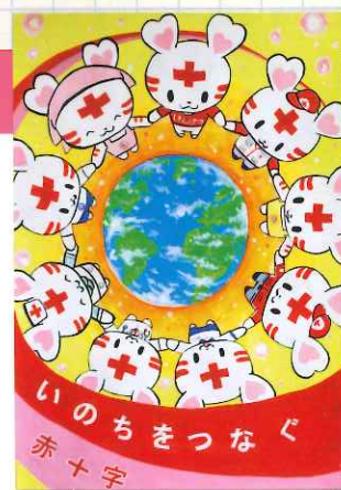
昨年の最優秀作品

いのちと健康を守る赤十字活動は、 皆さまからお寄せいただく活動資金で成り立っています