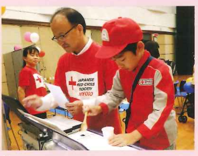
薬の分包機でチョコレートを包む体験

5月27日、ポップアップホール(丹波市)において、「つなげよう、地域に、未来に、赤十字」をテーマに「第6回ふれあい広場 in 丹(まごころ)の里」を開催。オープニングは、地元、春日戦国太鼓の皆さんの勇壮な演奏で大いに盛り上がり、その後、分包機でチョコレートを包む薬剤師体験、AEDを使った心肺蘇生と幼児安全法ミニ講習、認知症チェック、救護服やナース服を着てのキッズ記念撮影など、多くの市民の方々に体験していただきました。来場者からは「楽しませてもらった」「来てよかった」などの感想があり、秋田院長は「県立柏原病院との統合再編が進められる中、当院が廃院した後も地域の方々に赤十字に対する信頼、期待そして理解を深めていただきたいとの願いを込めた」と話していました。