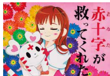
令和元年度の最優秀作品

詳しい応募要項は http://www.hyogo.jrc.or.jp/ から 赤十字 兵庫 を検索