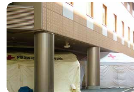
有症者は、施設外のテント内で診察